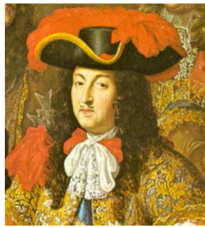
König Ludwig XIV. (gemeinfreies Bild)