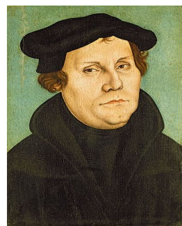
Martin Luther (gemeinfreies Bild)

© Text des Krimi-Märchens: Lydia Löwenherz. Frei zur privaten Nutzung. Die kommerzielle Nutzung oder Vervielfältigung ist ohne schriftliche Zustimmung der Urheberin untersagt. Dargestellte Bilder: freie Pixabay-Lizenz